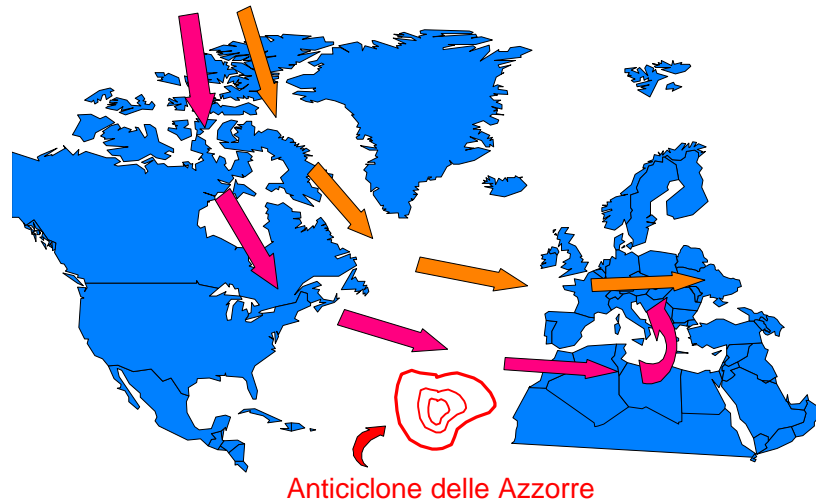
Anticiclone delle Azzorre durante l'inverno

Il passaggio più a sud delle correnti d'aria che attraversano l'Atlantico in direzione dell'Europa, crea le condizioni per un maggior assorbimento di energia dall'oceano sia per quanto riguarda l'aumento della temperatura che per l'aumento dell'umidità. Energia che raggiunge il nostro continente insieme alle perturbazioni e che viene ceduta all'ambiente circostante sotto forma di un clima più mite e abbondanti precipitazioni.