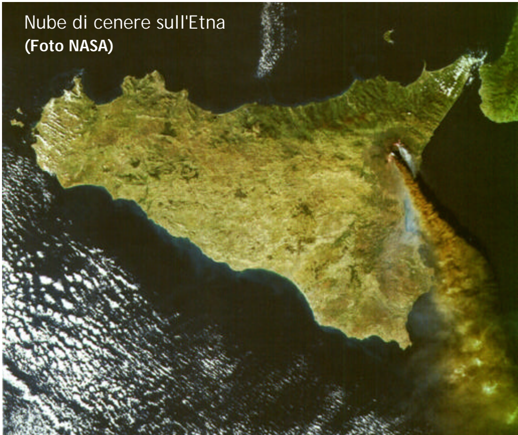
Nube di cenere sull'Etna